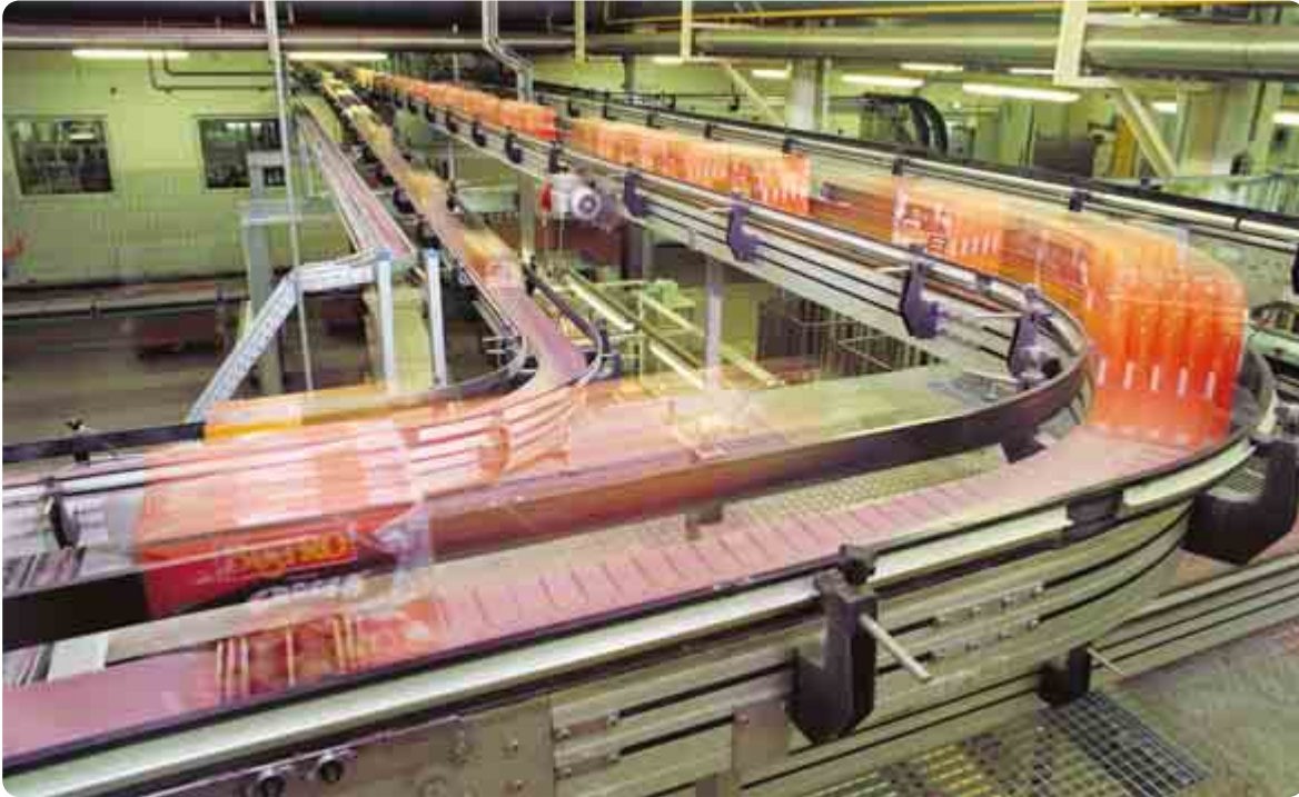
Bild 1: Die miprotek GmbH ist u. a. im Bereich der innerbetrieblichen Förder-technik tätig.