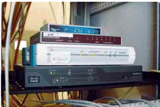
Bild 3: Der zentral installierte FL MGuard Delta (zweites Gerät von oben) nimmt sämtliche VPN-Verbindungen entgegen.