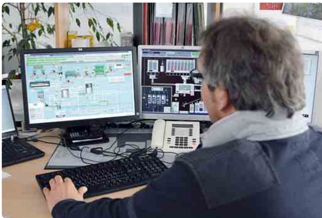
Bild 4: Selbst komplexe Visualisierungsgrafiken werden unverzerrt sowie in Echtzeit dargestellt.